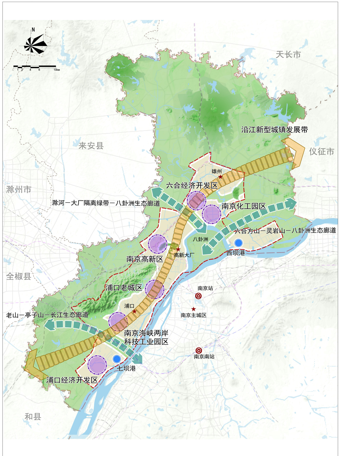
南京江北新区总体布局图